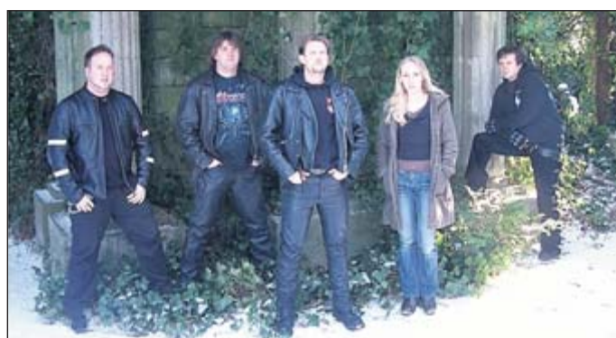
Auch die Band Pandoras Child steht bei „Tribute to Rock“ wieder auf der Bühne.

Spaden (bhi). Am kommenden Sonnabend, 27. März, steht wieder „Tribute to Rock“ in der Gaststätte „Die Linde“ in Spaden auf dem Programm. Nach einem Jahr Auszeit findet die Veranstaltung mit reichlich Livemusik zu Ehren des Rock bereits zum sechsten Mal statt: Und diesmal darf sich das Publikum neben den drei Bands auf weitere Highlights freuen. Eine „Happy Hour“ läutet ab dem Einlass um 19 Uhr die „Metal-Rock-Night“ ein. Um 20 Uhr folgt der Startschuss für die erste Band: Hi-Ro bietet den Zuhörern eine musikalisch überraschende Stil-Kombination, denn die fünf Musiker aus Hamburg lassen in ihren Songs HipHop und Rock zusammentreffen. Mit härteren Klängen steht Pandoras Child als zweiter Akt auf der