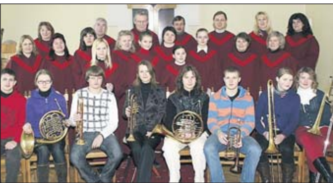
Ab Dienstag ist der Posaunenchor aus Klaipeda in Beverstedt zu Gast.

Musikern zum Gegenbesuch in Beverstedt. Live zu erleben sind die Gäste zusammen mit dem Beverstedter Kirchenchor sowie dem Posaunenchor am Freitag, 26. März, ab 19.30 Uhr in der Fabian- und Sebastian Kirche in Beverstedt.