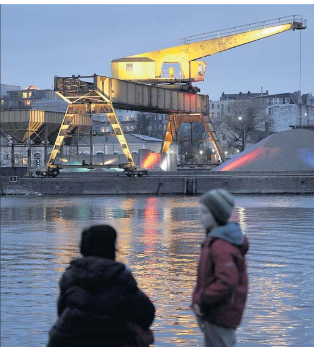
Der Grube-Kran am Neuen Hafen wird von „Das letzte Kleinod“ beleuchtet.